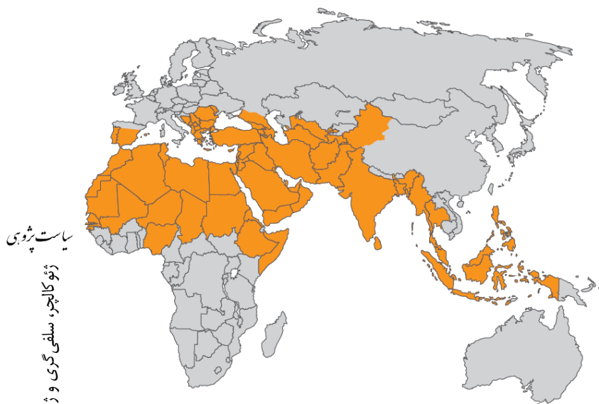
شکل ۳: نقشه خلافت رویایی ایمن الظواهری

است. بخش تبلیغاتی و رسانه‌ای داعش، نقشه اولیه‌ای را منتشر کرده که تمامی جهان را در بر می‌گیرد و محور آغازش نیز عراق و سوریه است. سپس، همسایگان نزدیک یعنی کویت، اردن، و لبنان تا فلسطین را شامل می‌شود. اخیراً داعش اسامی ۲۴ ولایت خود در کشورهای مختلف را اعلام نموده که کشورهای عربستان، یمن، لیبی، مصر و الجزایر را نیز شامل می‌شود. ۱۶ ولایت از ولایت‌های فوق در سوریه و عراق بوده و بقیه در یمن، الجزایر، سینا (مصر) برقه، فزان، طرابلس (لیبی)، بلاد الحرمین (عربستان) و خراسان است (موسوی، ۱۳۹۴: ۴۱). همانطور که ملاحظه می‌گردد برخی از این ایالات، همچون خراسان، در داخل ایران و برخی مثل سوریه عراق یمن لبنان و... جز قلمرو نفوذ ژئوپولیتیک ایران هستند.