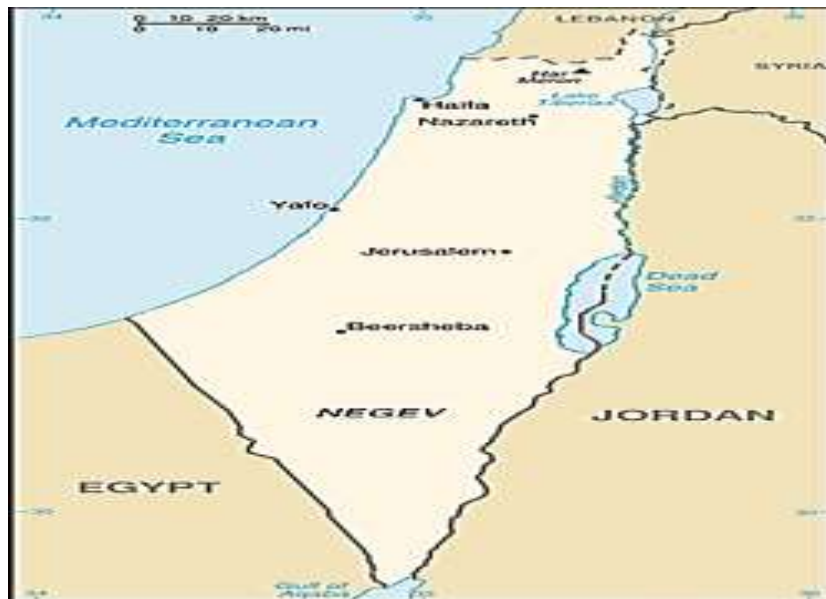
نقشه ۱. مناطق تحت استیلای بریتانیا پس از جنگ جهانی اول (داغر، ۱۳۹۱)

مسئله فلسطین و رژیم صهیونیستی را می‌توان بی‌تردید از مهم‌ترین و چالش برانگیزترین مباحث سده گذشته قلمداد نمود. این موضوع در گام نخست هم برای مسلمانان و هم برای یهودیان، وجهه ایدئولوژیک و اعتقادی دارد، به نحوی که یهودیان طبق کتب عهد عتیق سرزمین فلسطین را متعلق به خود می‌دانند و مسلمانان نیز به سبب وجود قبله نخست خود یعنی بیت المقدس، بسیار برای آن احترام قائلند (Alqaisiya, 2023: 597). به همین سبب، مذهب و ایدئولوژی نخستین و اصلی‌ترین علت منازعه صهیونیست‌ها با مسلمانان به طور عام و فلسطینیان به صورت خاص بوده است. با اشغال سرزمین فلسطین و دیگر ممالک اسلامی در خلال جنگ جهانی اول، دو قدرت آن دوران یعنی بریتانیا و فرانسه، سرزمین‌های بدست آمده را میان خود تقسیم نمودند که بر این اساس مناطق لبنان و سوریه امروز، تحت استیلای فرانسه و مناطقی از غرب اردن و فلسطین تحت زعامت بریتانیا درآمدند (Abahre et al, 2023: 238).