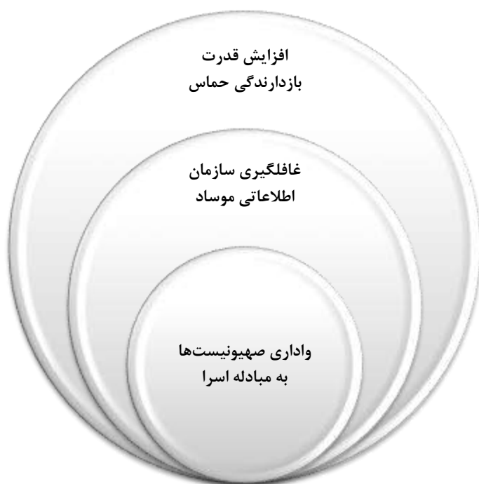
شکل ۴. سطح‌بندی عوامل مؤثر بر تغییر پارادایم مقاومت

گام پنجم: پس از استخراج سطوح، مدل ساختاری عوامل مؤثر بر تغییر پارادایم مقاومت و نمودار قدرت نفوذ و میزان وابستگی ترسیم شده است.