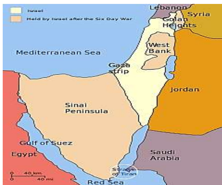
نقشه ۲. مناطق تحت استیلای صهیونیست‌ها پس از جنگ سوم با اعراب ۱ (زند، ۱۳۹۸)

صرف نظر از مباحث تاریخی شکل‌گیری رژیم صهیونیستی که از حوصله نوشتار کنونی خارج است، بایستی به پیامدهای این موضوع نیز نظری هرچند اجمالی انداخت. موضوعی که در ابتدا منجر به شکل‌گیری وحدت نسبی اعراب علیه تأسیس صهیونیست‌ها و جنگ‌های چهارگانه (سال‌های ۱۹۴۸، ۱۹۵۶، ۱۹۶۷ و ۱۹۷۳) منتهی شد، ولی در عمل نه تنها نتیجه‌ای برای اعراب نداشت و عملاً به تسلط هرچه بیشتر صهیونیست‌ها بر مناطق اشغالی و آوارگی فلسطینیان منتهی گردید (Hasan & Bleibleh, 2023: 284). به عنوان مثال، در جنگ شش روزه ۱۹۶۷ که سومین نبرد اعراب و صهیونیست‌ها بوده است، صهیونیست‌ها، نوار غزه، صحرای سینا، کرانه باختری رود اردن (شامل اورشلیم شرقی) را تصرف نموده و وسعت مناطق اشغالی از سوی آنان به سه برابر رسید (اور، ۱۴۰۱: ۲۵).