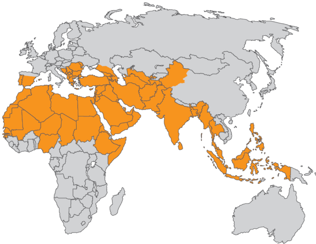
شکل ۳: نقشه خلافت رویایی ایمن الظواهری

در بر می‌گیرد و محور آغازش نیز عراق و سوریه است. سپس، همسایگان نزدیک یعنی کویت، اردن، و لبنان تا فلسطین را شامل می‌شود. اخیراً داعش اسامی ۲۴ ولایت خود در کشورهای مختلف را اعلام نموده که کشورهای عربستان، یمن، لیبی، مصر و الجزایر را نیز شامل می‌شود. ۱۶ ولایت از ولایت‌های فوق در سوریه و عراق بوده و بقیه در یمن، الجزایر، سینا (مصر) برقه، فزان، طرابلس (لیبی)، بلاد الحرمین (عربستان) و خراسان است (موسوی، ۱۳۹۴: ۴۱). همانطور که ملاحظه می‌گردد برخی از این ایالات، همچون خراسان، در داخل ایران و برخی مثل سوریه عراق یمن لبنان و ... جز قلمرو نفوذ ژئوپولیتیک ایران هستند.