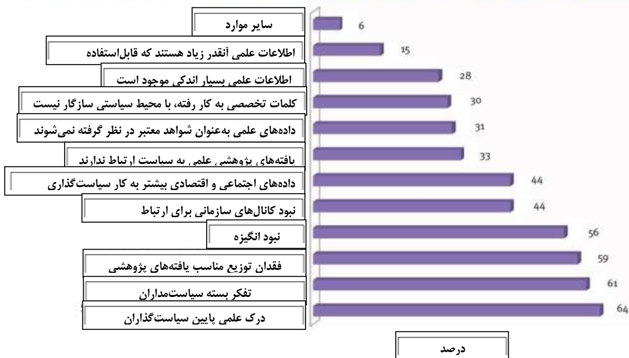
شکل ۲- موانع استفاده از اطلاعات علمی در سیاست‌گذاری توسعه

با وجود تأکید در آثار مختلف بر تضاد یا استقلال جوامع پژوهشگر و سیاست‌گذار، فرصت بیشتر تعامل، بحث و مذاکره بین پژوهشگران و سیاست‌گذاران باعث بهبود روند استفاده از یافته‌های پژوهشی در تصمیم‌گیری سیاستی می‌شود؛ کما اینکه یافته‌های تحقیق مذکور نشان‌دهنده‌ی نیاز فوری و رفع نشده به انتقال بهتر شواهد علمی و فنی به سیاست‌گذاران است. همچنین حدود ۵۰ درصد سیاست‌گذاران و ۶۵ درصد پژوهشگران احساس می‌کردند؛ که توزیع ناکافی یافته‌های پژوهشی برای استفاده در سیاست وجود دارد (کلاً ۵۹ درصد پاسخ‌دهندگان). در این تحقیق، گزارش‌های سیاستی به‌عنوان ابزار اصلی برای پر کردن این خلأ شناخته شدند و ۷۹ درصد پاسخ‌دهندگان از هر دودسته کشورهای روبه توسعه و توسعه‌یافته، خلاصه‌های سیاستی را