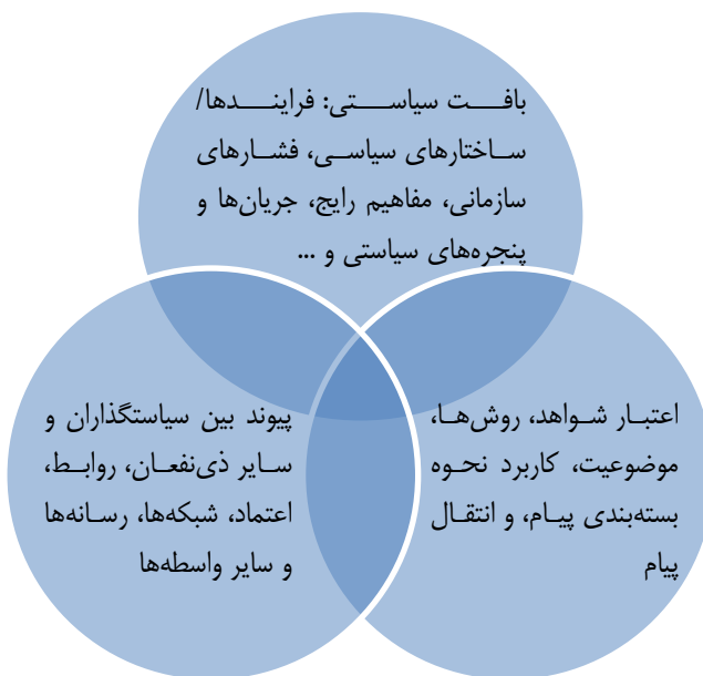
شکل ۳ - عناصر سازنده یک گزارش سیاستی