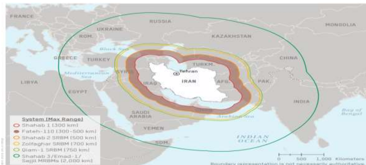
نقشه ۱- برد توان موشکی ج.ا. ایران (DIA, ۲۰۱۹, p. ۵۳)

توانایی‌های دریایی ایران استراتژی قطع دسترسی منطقه‌ای از سوی ایران را مورد تأکید دارد. ایران با بهره‌مندی از موقعیت ژئواستراتژیک خود در امتداد خلیج فارس و تنگه هرمز، قابلیت‌های دریایی مبتنی بر تاکتیک‌های نامتقارن با استفاده از پلتفرم‌ها و سلاح‌های بی‌شماری که می‌تواند برای غلبه بر نیروی دریایی دشمن مؤثر باشد را توسعه داده است. طیف گسترده‌ای از این قابلیت‌ها برای ایران در دسترس است که شامل: موشک‌های کروز سوار بر کشتی و مستقر در ساحل، قایق‌های کوچک تندرو، مین‌های دریایی، زیردریایی‌ها، هواپیمای بدون سرنشین، موشک‌های بالستیک ضدکشتی و دفاع هوایی است.