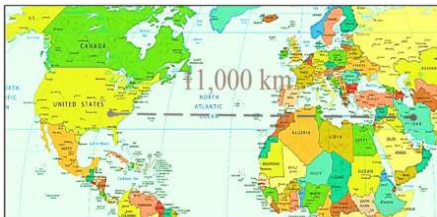
تصویر ۱. فاصله جغرافیایی ایران و آمریکا (آدمی و نورانی، ۱۳۹۸: ۱۲۵)

دهند. در نتیجه حوزه راهبردی ایران را تحت تأثیر آن‌ها قرار خواهد گرفت (صالحی و فرح‌بخش، ۱۳۹۵: ۵۲-۵۱).