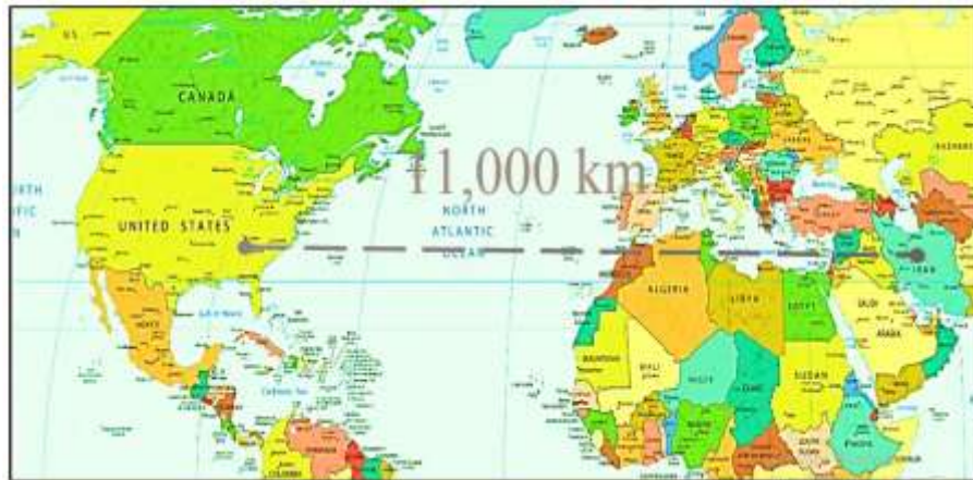
تصویر ۱. فاصله جغرافیایی ایران و آمریکا (آدمی و نورانی، ۱۳۹۸: ۱۲۵)

دهند. در نتیجه حوزه راهبردی ایران را تحت تأثیر آن‌ها قرار خواهد گرفت (صالحی و فرح‌بخش، ۱۳۹۵: ۵۲-۵۱).