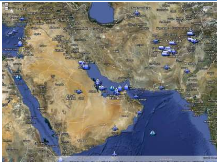
تصویر ۲. نقشه پایگاه‌های نظامی آمریکا در پیرامون ج.ا.ایران

اما به نظر می‌رسد مسئولین سیاسی آمریکا گزینه اقدام نظامی علیه ج.ا.ایران را از اولویت برنامه‌های خود کنار گذاشته و تلاش می‌کنند تا با فشار اقتصادی و مذاکرات سیاسی به اهداف مدنظر دست یابند. هرچند که احتمال اقدام نظامی محدود جهت متقاعد کردن ج.ا.ایران در هر زمان متصور می‌باشد؛ اما آنچه از شواهد و قرائن برمی‌آید، این است که اولاً احتمال اقدام نظامی مستقیم و همه‌جانبه خیلی ضعیف شده و حداقل در چند سال آینده متصور نمی‌باشد؛ اما آنچه از تحولات اخیر منطقه استنباط می‌شود دکترین جنگی آمریکا تغییر کرده و از جنگ مستقیم به جنگ نیابتی توسط گروه‌های تروریستی و با هزینه کشورهای عرب محافظه کار منطقه تغییر یافته است و آمریکا درصدد از بین بردن عمق استراتژیک ج.ا.ایران و به نوعی درگیر نمودن کشور در جنگ با گروه‌های تروریستی در مرحله اول در خارج از مرزها و در ادامه هدایت این گروهک‌ها به داخل برخی مناطق مرزی از جمله غرب، شمال غرب، جنوب غرب و جنوب شرق خواهد بود. از سوی دیگر آمریکا از طریق رسانه‌ها، بر شعله‌ور ساختن اعتراضات اجتماعی در ایران دامن می‌زند. به طوری که تأثیر اخبار و برنامه‌های سیاسی شبکه «سی. ان. ان.» (CNN) آمریکا به اندازه‌ای است که نخبگان سیاسی