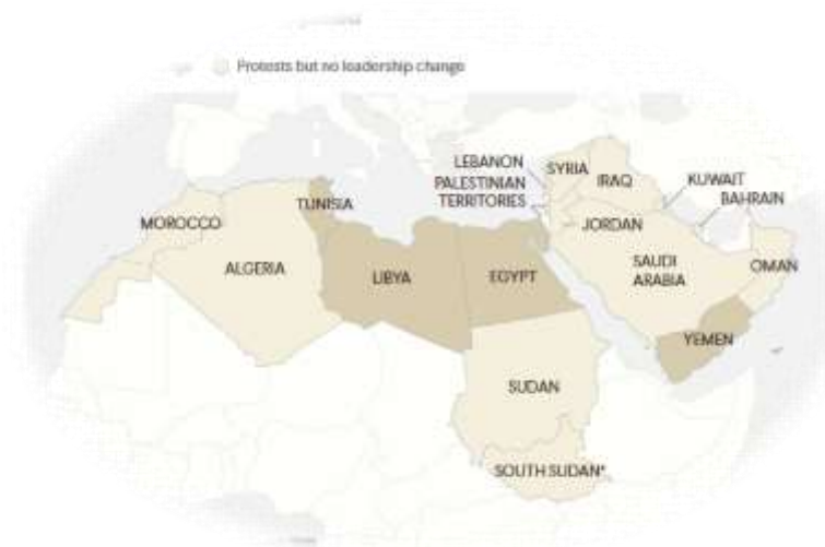
نقشه شماره ۱- کشورهای درگیر بیداری ۲۰۱۱

پدیده بیداری اسلامی و بهار اسلامی، یکی از مهم‌ترین و اساسی‌ترین مسائل در منطقه غرب آسیا است و در بین کارشناسان و پژوهشگران، تعریف یکسانی از آن وجود ندارد. بیداری در فارسی، مترادف «الصحوه»، «الوعی» و «یقظه» در زبان عربی است (دارابی، ۱۳۹۹: ۱۱۵). در مجموع بیداری ۲۰۱۱، رویدادهای اجتماعی، فرهنگی، مذهبی، سیاسی و اقتصادی است که تاریخ از آن به‌عنوان «بهار اسلامی» یا «بیداری اسلامی» یاد می‌کند و موجی از شوک پنج‌گانه (اقتصادی، نظامی، سیاسی-امنیتی، زیست‌محیطی و اجتماعی-فرهنگی) بر کل منطقه ایجاد کرد. امروزه، میراث زنجیره این رویدادها مورد اختلاف است و تا حدودی هنوز نامشخص است (Adraoui, 2021).