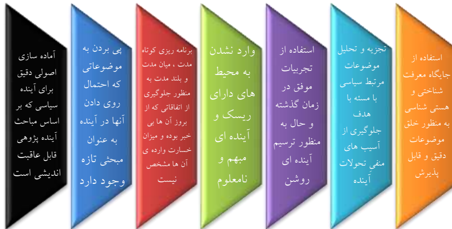
نمودار شماره ۲. اهداف آینده پژوهی سیاسی (عیوضی، ۱۳۹۵:۱۸۱)

با توجه به آنچه اندیشمندان در زمینه‌ی مطلب مذکور عنوان کرده‌اند، از نخستین دوران پیدایش مفاهیم علم سیاست، هر آنچه مرتبط با آینده‌ی این علم بوده است نیز مورد توجه بزرگان قرار داشته است. آن‌ها هدف از پرداختن به این مهم را عبور از وضع موجود و رسیدن به وضعیتی بهتر و مساعدتر عنوان کرده‌اند (اسپرینگز، ۱۳۷۰: ۱۴۳). اهمیت آینده پژوهی در علم سیاست را می‌توان از این بُعد نیز مورد بررسی قرارداد که این مهم قادر خواهد بود فضایی مناسب را جهت به وجود آوردن جلوه‌ای جدید از آینده‌ای سعادت‌مند را در فکر اندیشمندان پدید آورد تا وی بتواند با ترسیم نقشه‌ای دقیق در ذهن خود، جامعه‌ای مطلوب از نظر سیاسی را پی‌ریزی نماید. درنهایت آینده پژوهی سیاسی را می‌توان چنین تعریف کرد که این مبحث به دنبال ترسیم آینده‌ای روشن به‌منظور رهایی از موضوعات و چالش‌هایی است که قادر خواهند بود در آینده جامعه را چه در بُعد داخلی و چه در بُعد خارجی درگیر خود نمایند. آینده پژوهی سیاسی با استفاده از شیوه‌های روش‌شناسی علمی قادر خواهد بود تا چراغ‌های آینده را پیش روی مخاطب خویش به‌درستی و با تحلیل‌های قابل‌پذیرش و علمی روشن نموده و کمک بسیار بزرگی به پیش‌برد اهداف مردان سیاست در تصمیم‌گیری‌هایشان داشته باشد.