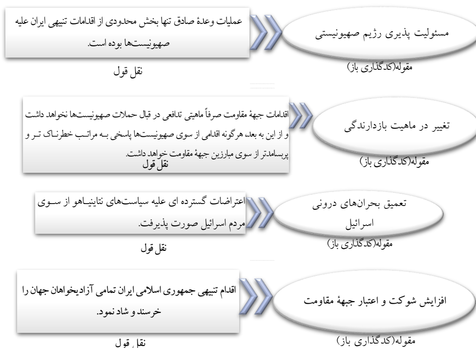
شکل ۱- نمونه‌ای از چگونگی انجام مراحل آشنانشدن و برجسب زنی داده‌ها

نمونه ای از چگونگی انجام مراحل آشنانشدن و برجسب زنی داده‌ها در شکل ۱ ارائه شده است: