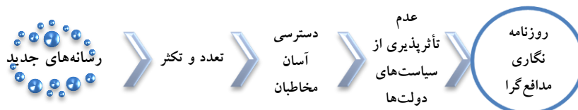
شکل-۲. نقش رسانه‌ها جدید در روزنامه‌نگاری مدافعه‌گرا

در این مسیر رسانه‌های مبتنی بر فضای مجازی یا اینترنت، نظیر انواع شبکه‌های اجتماعی و وبسایت‌های خبری و مبتنی بر روزنامه‌نگاری شهروندی و عینی، توانسته است اخبار تحولات فلسطین و از جمله طوفان الاقصی را به مخاطبان بین‌المللی ارائه دهد. این فضای آزاد، ارابه اطلاعات و دسترسی سهل‌الوصول‌تر به این قبیل رسانه‌ها، سبب شده است واقعیت‌ها منطقه علی‌رغم سانسورهای شدید خبری از سوی رژیم اسرائیل، در مظان توجه افکار عمومی جهان واقع شود. نمونه این مسأله را در ارابه اطلاعات دقیق از حملات حزب‌الله لبنان به اسرائیل و با استفاده از ابزارهای ارتباطی جدید مشاهده کرد؛ در حالی است که رسانه‌های بین‌المللی همسو با رژیم صهیونیستی در تلاش‌اند اخبار تلفات و خسارت‌های وارده را کتمان و یا حداقل کم اثر جلوه دهند. این مقوله توصیف روشنی از نقش رسانه‌های نوین در بیان اخبار مربوط به تحولات فلسطین است که در کنار اعلام شهادت روزانه و به تصویر کشیدن سبب اسرائیل، ارتباط تنگاتنگ روزنامه‌نگاری مدافعه‌گرا و ابزارهای جدید ارتباطی را نشان می‌دهد.