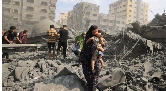
(Mizan News Agency, 2024: 2)

تصویر-۲. حمله هوایی ارتش اسرائیل به بیمارستان شفا