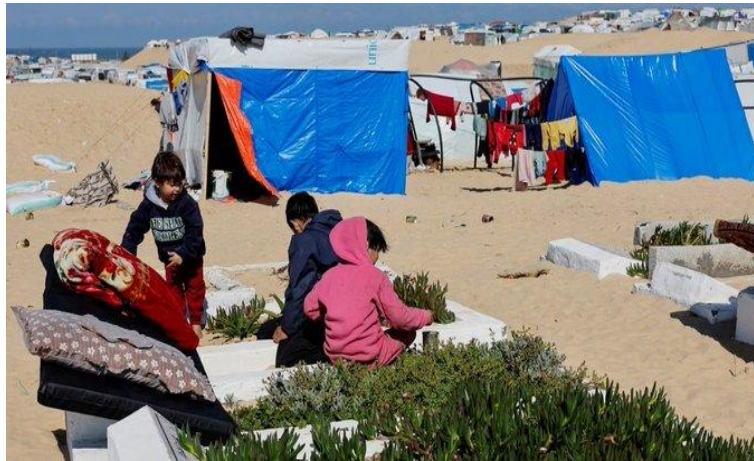
(Islamic Republic News Agency, 2023: 2)

در ۳ دسامبر ۲۰۲۳، ارتش اسرائیل دستور تخلیه فوری ۲۰ درصد از شهر خان یونس را صادر کرد. این منطقه قبل از جنگ محل سکونت نزدیک به ۱۱۷۰۰۰ نفر بود. سازمان عفو بین‌الملل استفاده از بمب‌های بزرگ را گزارش کرده است که احتمالاً تا ۲۰۰۰ پوند وزن دارند. این روش نبرد در یک منطقه پرجمعیت به طور اجتناب‌ناپذیری منجر به تلفات غیرنظامی بسیار زیاد می‌شود. علاوه بر این، استفاده ادعایی از فسفر سفید توسط نیروهای اسرائیلی در مناطق شهری پرجمعیت غزه توسط دیده بان حقوق بشر در تهاجم فعلی و همچنین در حملات قبلی گزارش شده است (Diakonia, 2023: 32). طبق حقوق بین‌الملل بشردوستانه عرفی، کاربرد سلاح‌های آتش‌زایی که ایجاد درد و رنج غیرضروری می‌کنند؛ ممنوع است (Tadini And Hayati, 2018: 191). بنابراین هرگاه سلاح مشابهی موجود است که درد و رنج غیرضروری کمتری ایجاد می‌کند؛ نباید از فسفر سفید به عنوان سلاح ضد نفر استفاده کرد. در حقوق بین‌الملل، فسفر سفید به عنوان یک سلاح شیمیایی احصاء نشده و بنابراین در معاهدات بین‌المللی کاربرد آن ممنوع نیست؛ اما کاربردش مانند سایر سلاح‌ها توسط اصول اساسی حقوق بین‌الملل بشردوستانه محدود شده است؛ از جمله این که باید به شیوه‌ای به کار رود که تفکیک میان نظامیان و غیرنظامیان را رعایت شود و هرگز غیرنظامیان هدف قرار نگیرند. بنابراین، بمباران هوایی مناطق مسکونی با مهمات حاوی فسفر سفید