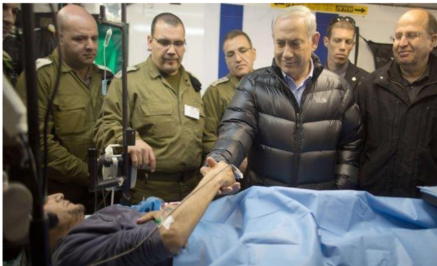
تصویر-۱. عیادت بنیامین نتانیاهو از مجروحان داعش در سرزمین‌های اشغالی