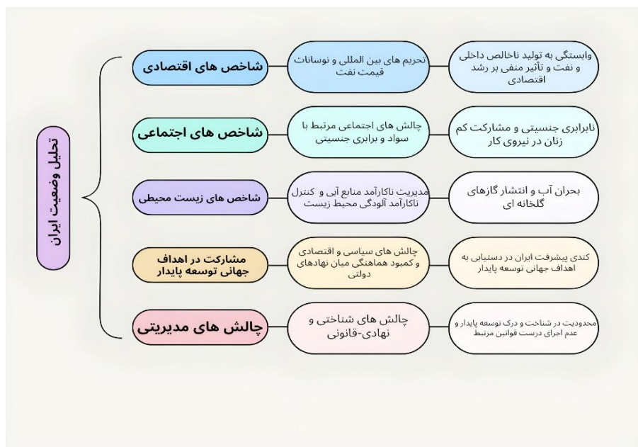
شکل ۲: تحلیل وضعیت ایران از منظر شاخصه‌های توسعه پایدار

با توجه به شکل ۲، چالش‌های مدیریتی در ایران تأثیرات منفی قابل توجهی بر توسعه پایدار کشور داشته‌اند. برای حرکت به سمت توسعه پایدار، ایران نیازمند اصلاحات جدی در حوزه‌های اقتصادی، زیست‌محیطی و حکمرانی است. بهبود مدیریت منابع طبیعی، تنوع‌بخشی به اقتصاد، ارتقای شاخص‌های توسعه انسانی، تقویت ثبات سیاسی و حکمرانی کارآمد، از جمله اقداماتی است که می‌تواند به بهبود وضعیت توسعه پایدار در ایران کمک کند.